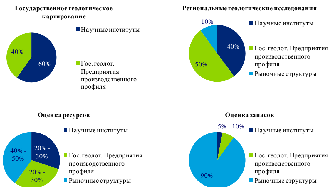
Рис. 5. Доли участников рынка геологоразведочных услуг в разрезе этапов геологического процесса, %

Работы на первых двух этапах процесса осуществляются в основном за счет государственных средств. На этапах, включающих работы по воспроизводству минерально-сырьевой базы (последние два этапа процесса) работы в основном выполняются за счет средств недропользователей (99% работ по оценке запасов выполняются за счет средств недропользователей). При этом на этих двух этапах рынок демонстрирует средний и высокий уровень конкуренции. На Рис. 5 представлено распределение рынка по типам организаций-исполнителей работ на каждом этапе геологического процесса.